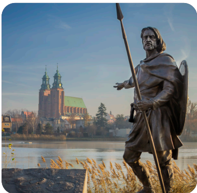
Pomnik Lecha w Gnieźnie