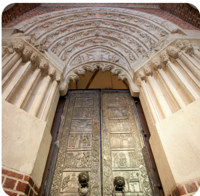
Drzwi Gnieźnieńskie