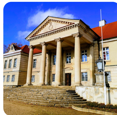
Portal pałacu w Czarniejewie

Okazate założenie pałacowo-parkowe nasuwa skojarzenia z najwspanialszymi siedzibami wielkopolskich rodów w Rydzynie i Rogalinie. Nic dziwnego, ich architekci projektowali także tutejszy kompleks. Dziś mieści on hotele i restaurację. We wnętrzach pałacu podejmowano znakomitych gości: to tutaj przybyli na obiad prezydenci sześciu państw podczas pielgrzymki Jana Pawła II w 1997 r.