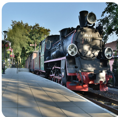
Makieta kolejki we Wrześni

Miasto rozstawił przed ponad stu laty strajk dzieci. O polskich uczniach protestujących przeciwko nauczaniu religii w języku niemieckim usłyszała wtedy cała Europa. Dziś wydarzenia te przypomina stała wystawa w Muzeum Regionalnym. Mieści się ono w budynku szkoły, w której odbywał się strajk.