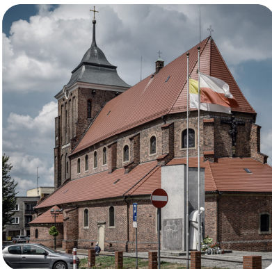
Września, fara