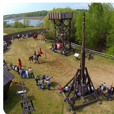
Gród Pobiedziska, fot. Bartosz Styszyński

W Skansenie Miniatur Szlaku Piastowskiego zobaczymy wierne kopie budowli w skali mikro. Gród Pobiedziska zaprasza natomiast na przygodę z udziałem machin oblężniczych. Można samemu naciągnąć gigantyczny trebusz i wystrzelić hen daleko kamienny pocisk. Można postrzelać z łuku lub beztrzesko pokręcić się na rekonstrukcji karuzeli sprzed wieków.