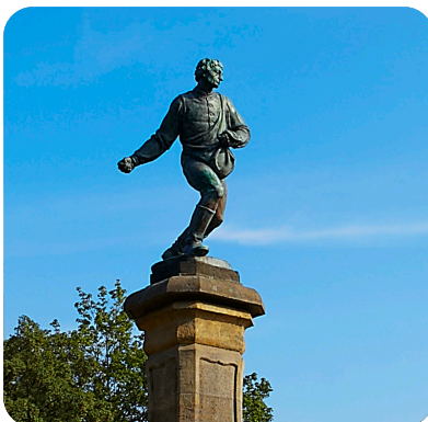
Pomnik Siewcy