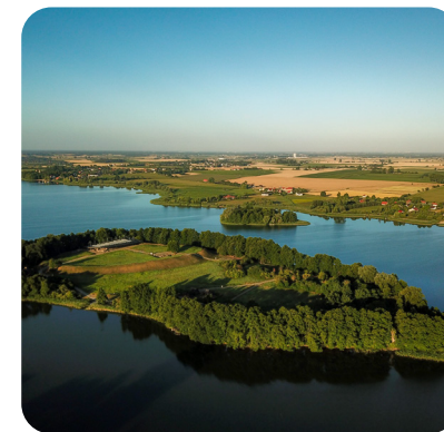
Ostrów Lednicki

Wyspa skarbów, chrzcielnica Polski. Przeprawa promem urozmaici wycieczkę pełną zadumy nad przeszłością. Na wyspie, po której stąpali Mieszko I i Bolesław Chrobry, zobaczymy relikty pałatium i kaplicy z basenami chrzcielnicami. Gospodarzem miejsca jest Muzeum Piastów na Lednicy.