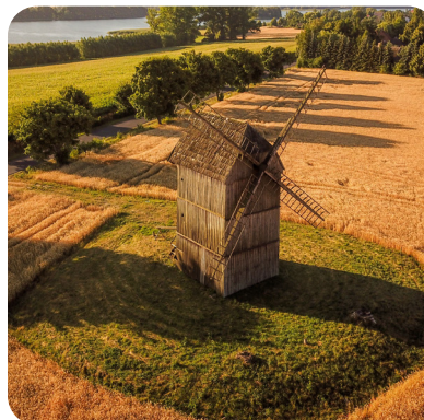
Skansen w Dziekanowicach

W tym jednym z największych w Polsce skansenów wszystkimi zmysłami doświadczymy, jak toczyło się życie w XIX-wiecznej wsi wielkopolskiej. Na niezwykłą atmosferę tego miejsca składa się nie tylko autentyczna architektura drewniana, meble czy urządzenia. Dziekanowice to rodzaj żywego skansenu: tu spotkamy zwierzęta gospodarskie czy stare odmiany drzew owocowych.