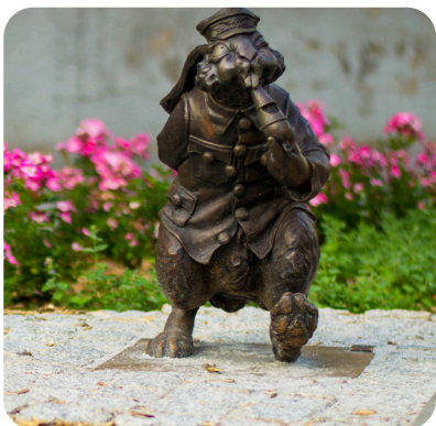
Figurka królika kolejarza, fot. Sebastian Uciński/UM Gniezno

Przed wiekami miejsce to upodobał sobie i wybrał na siedzibę rodu legendarny Lech. Na wzgórzu jego imienia majestatycznie wznosi się katedra, świadek ponadtysiącletniej historii miasta. Gniezno stawia także na kulturę, oświatę, sport, inwestycje i oczywiście na turystykę. Oferuje gościom świetną bazę noclegową i gastronomiczną.